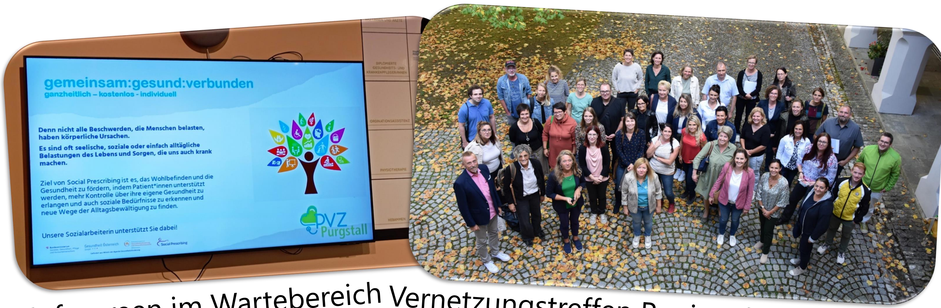
Infoscreen im Wartebereich Vernetzungstreffen Regionalteam Scheibbs Oktober 2023