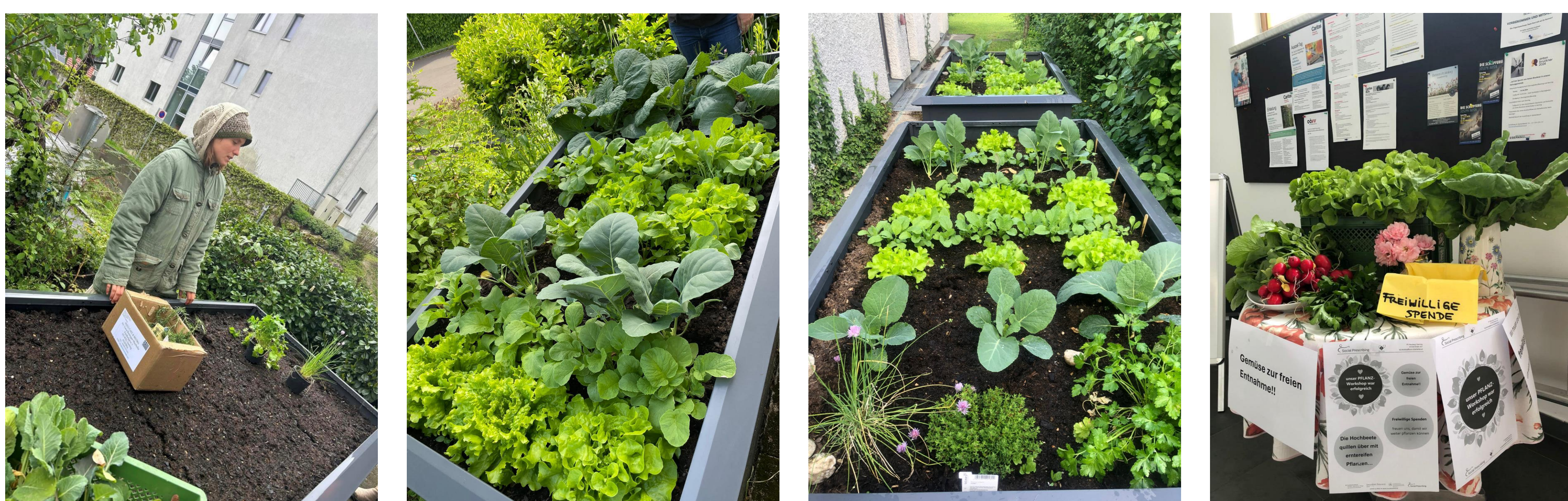
florierendes Gartenprojekt im PVN Neuzeug-Sierning