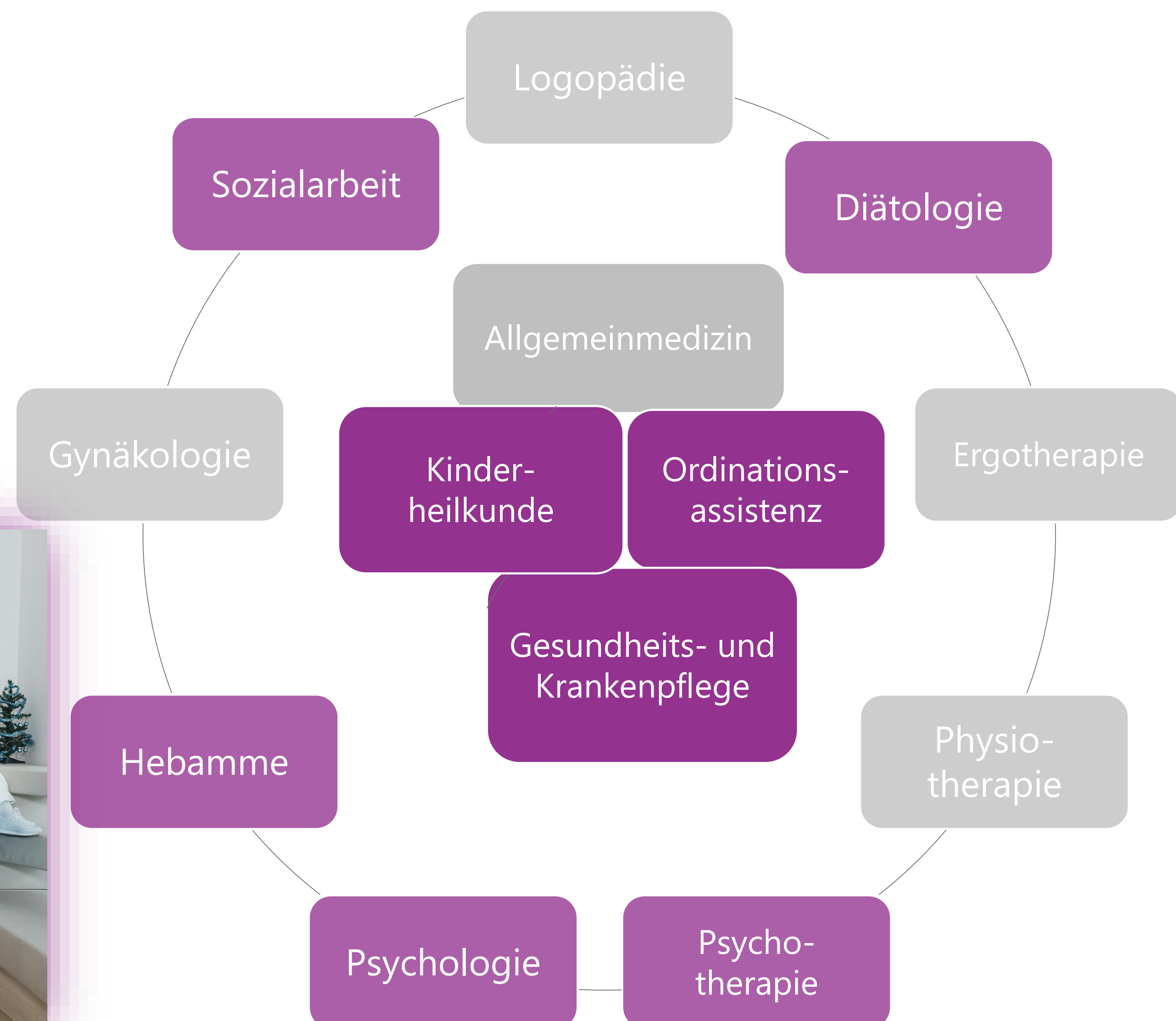
farblich hervorgehoben: in der Einrichtung vertretene Berufsgruppen