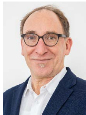
Bundesminister Johannes Rauch

Es freut mich nun ganz besonders, dass die Bundes-Arbeitsgruppe von Menschen mit Demenz und ihre Unterstützer:innen diesen Ratgeber von Betroffenen für Betroffene erarbeitet haben. In der vorliegenden Broschüre werden die Themen frühe Abklärung, offener Umgang mit der Krankheit aber auch Selbstbestimmung und soziale Teilhabe